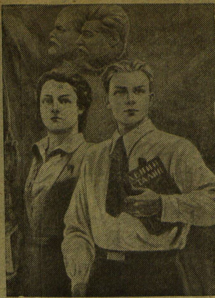
Плакат работы художника М. Соловьева, выпущенный издательством «Искусство» Прессклине ТАСС.